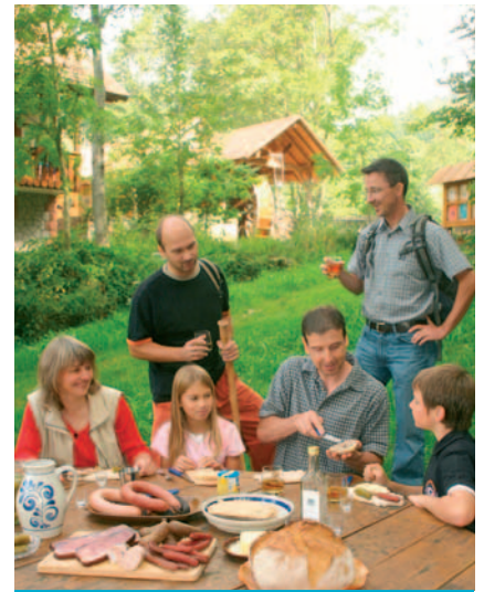
SEEBACH | MUMMELSEE

Op de boerderijen wachten ondertussen de vele dieren op speelkameraadjes om geaaid te worden. Speeltuinen, vakantieprogramma voor de kinderen, tochtjes, avontuurlijke speelplaatsen - alles, wat het kinderhart begeert.