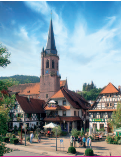
KAPPELRODECK | WALDULM