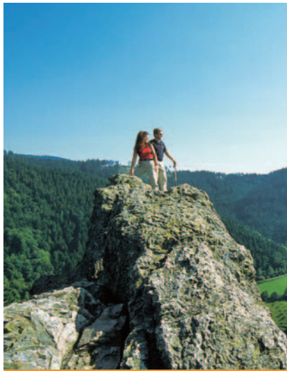
OTTENHÖFEN IM SCHWARZWALD

Alleen een kattensprong van Kappelrodeck verwijderd ligt Waldulm. Een rode wijn dorp dat zijn weerga niet kent. Hier lijkt de tijd te hebben stilgestaan en is de alledag van de wijnbouwers alom merkbaar. Waar vakwerk en bloemenpracht stralend wedijveren, en vanuit de ramen een verse baklucht uw neus bekoort. Neemt u de uitnodiging tot een ontdekkingsreis aan en geniet dag voor dag van uw welverdiende vakantie. Kappelrodeck en Waldulm zijn een ideaal vakantieparadijs voor families en vakantiegangers die liever lekker slenteren, wandelen en fietsen dan hoge bergen beklimmen.